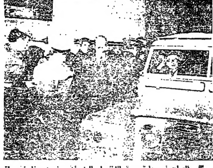
المصالح في سيارة سيرة الاطفاء والوزيران ساسين وخلفها يراقبان